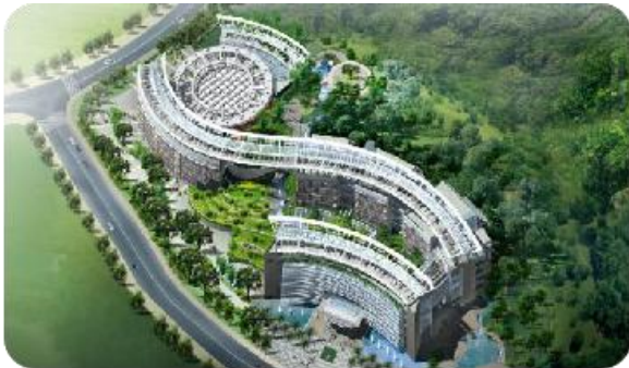
广东省电力设计院

星级酒店管理、康体中心管理、员工后勤保障等。目前，已承接中国移动通信集团广东有限公司广州分公司、广发金融中心（南海）、中国能源建设集团广东省电力设计研究院有限公司、中国移动通信集团广东有限公司揭阳分公司、中国移动通信集团广东有限公司汕尾分公司等项目。