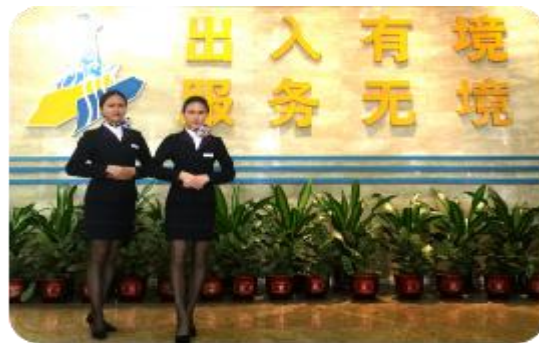
广州市公安局出入境大厦