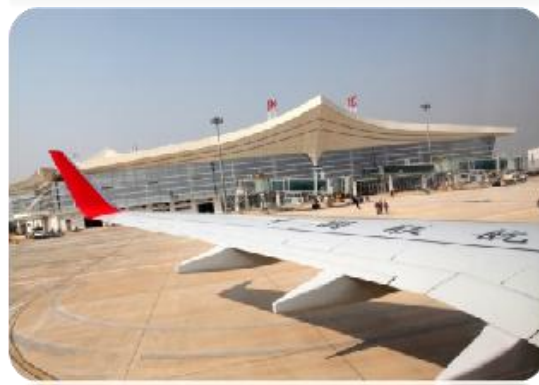
湖南衡阳南岳机场