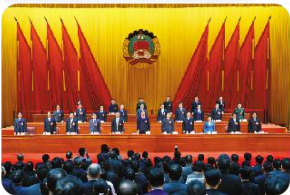
广东省政协办公楼