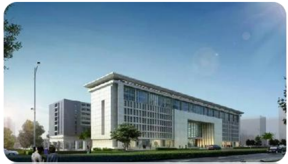
广东产品质量监督检验研究院